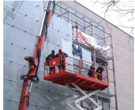
Fugen im Fenster- und Fassadenbereich