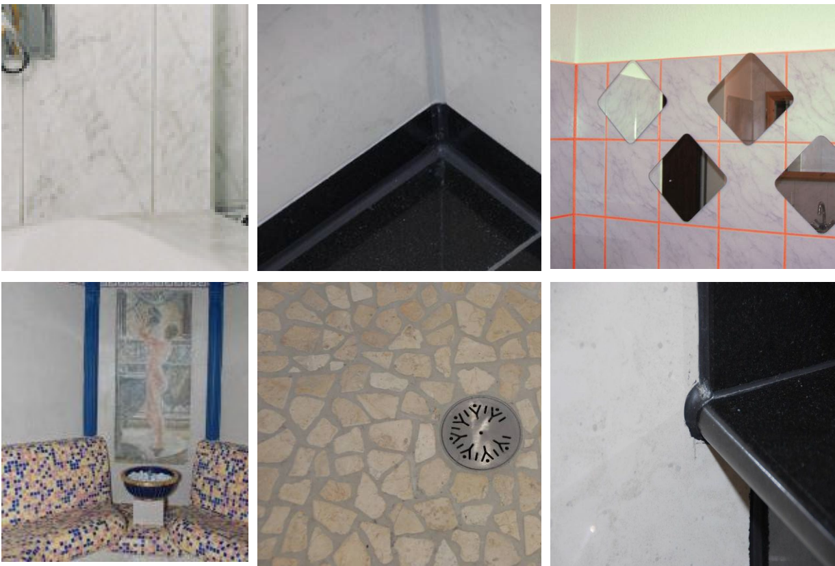
Fugen im Sanitär- und Nassbereich